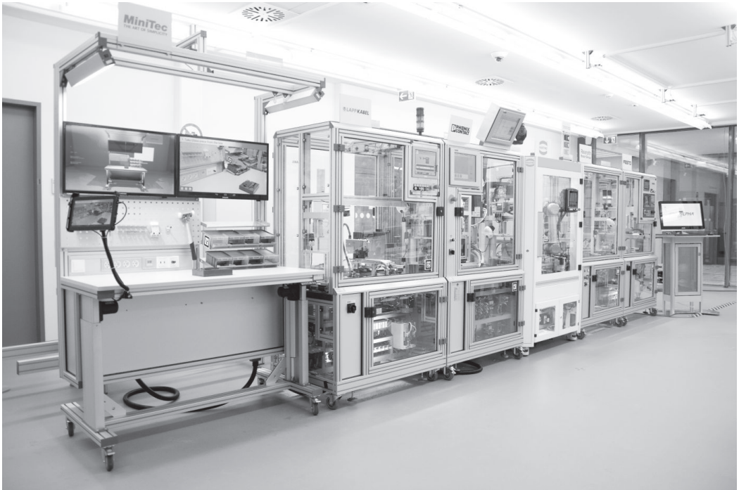
Abbildung 2: Test- und Demonstrationsanlage der Technologie-Initiative SmartFactory KL e.V. mit den herstellereinspezifischen Produktionsmodulen