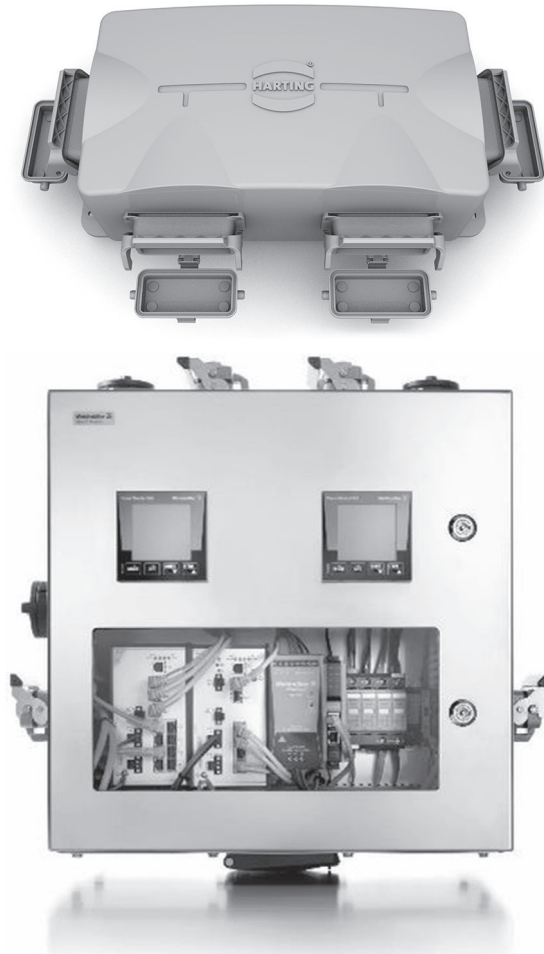
Abbildung 3: Die Infrastrukturbox der Firma Harting (links) und die Infrastrukturbox der Firmen Weidmüller und Belden/Hirschmann (rechts) sind miteinander kompatibel