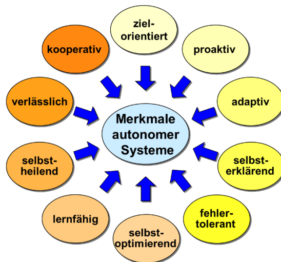
Fig. 2: Merkmale autonomer Systeme

Proaktivität: Das System kann vorausschauend agieren und bei seiner Handlungsplanung zukünftig zu erwartende Ereignisse in seiner Umgebung antizipieren.